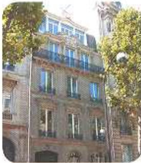
مقر Forever Living Products في باريس

تتواجد الشركة اليوم في أكثر من 100 دولة وتنتج رقم أعمال يناهز 4 مليا دولار. و قد أنشأت منذ سنة 1993 في فرنسا العاصمة، و منذ 1995 في غاودلوبي، المارتينيك و غويانا .